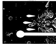
▲頭上放射の「男のビーム」でビルダー軍を撃滅なり!