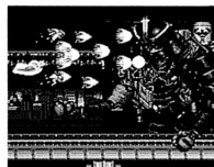
▲華麗な弁天のオプションにはカワイイ天使たちも。